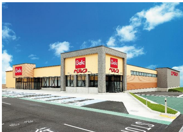
2024年4月17日OPEN、ベルク中之条店

2024年3月時点、ベルク一部店舗(ベルクすねおり店・ベルクフォルテ津田沼店)で導入しておりますレジ専用イスを2024年4月17日(水)群馬県吾妻郡中之条町にオープンするベルク中之条店に導入。新店舗で初の試みとしてレジ従業員の声やお客様の反応を収集、イスの導入店舗拡大や業務改善につなげていきます。